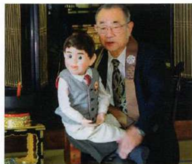
芥川龍之介作「蜘蛛の糸」の公演

に助けられて「ロゴス腹話術研究会」より、芸名「春風赤とんぼ」を授かった。 訪問先は、小学校・幼稚園・保育園・寺院を中心に福祉施設・老人クラブ・自治区等多岐にわたり、最近では、年間七十〜八十か所から予約が入るようになった。話題は、それぞれだが、子どもたちには、少しでも「いじめ」を無くしたいという思いを伝えている。 台本づくりは面白く、自己研鑽の機会となっている。今日的な「オレオレ詐欺」を取り上げた折には、警察署の生活安全課で詳しく親切にアドバイスをい