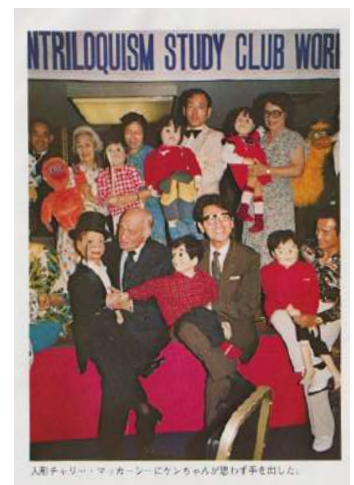
世界大会でのエドガー・バーゲン氏とイチロー師匠