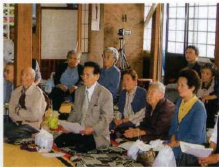
お寺での公演 真剣に視聴

に助けられて「ロゴス腹話術研究会」より、芸名「春風赤とんぼ」を授かった。 訪問先は、小学校・幼稚園・保育園・寺院を中心に福祉施設・老人クラブ・自治区等多岐にわたり、最近では、年間七十〜八十か所から予約が入るようになった。話題は、それぞれだが、子どもたちには、少しでも「いじめ」を無くしたいという思いを伝えている。 台本づくりは面白く、自己研鑽の機会となっている。今日的な「オレオレ詐欺」を取り上げた折には、警察署の生活安全課で詳しく親切にアドバイスをい