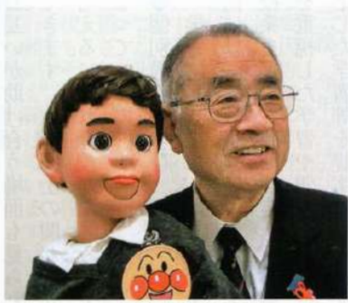
人形「けんちゃん」との掛け合い

しばらくすると、子どもたちに人権に関する話をしてほしいと要請があり、困惑した。子どもたちの前で話をする事には慣れていないもの、内容は多岐にわたり難しい。あれこれ考えた末、腹話術の手法で、子どもたちの心情に訴えようと思った。少し手ほどきを受け、練習す