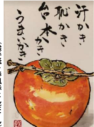
(絵手紙：春風赤とんぼさん)

なつかしいお声を聞き、昔を思い出し、感激しました。人形の名前は、その当時警察官で「キューちゃん」と呼ばれ、皆さまに慕われていましたので、私も「キューちゃん」と名づけました。