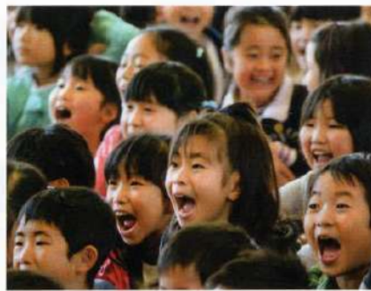
屈託のない笑い声 小学校での人権に関する公演

れば、できるだろうと軽く考えていたが、難しく奥の深い芸である事を思い知らされた。頼まれて行くもの、一時はもうやめようかと迷った。しかし、子どもたちの真剣な眼差し、ほほえみ、屈託のない大きな笑い声に励まされて、初志貫徹しようと思いつまった。