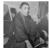
春風亭柳橋

島村 そう。 春風 部屋代がタダで、3食付きという居候（笑）。1か月近くタダで食べさせてもらいました。そのとき、賀川豊彦先生（注：大正・昭和期の社会事業家、平和活動家、キリスト教伝道者）の伝道集会があったわけです。それに出不さいよと言うんです。 島村 は、はあ。 春風 僕は出るつもりはなかったんですけども、腹減ってるので、どうしても4杯目を出したわけです。そうしたら牧師さんの奥さんが全部おはちを空にして、ギューっと仏様みたいにご飯を盛って、あんた出なきゃだめよって出したわけ。これを食べれば賀川先生の集会に出なきゃいかん、出ないためには、ガマンしなきゃいかんと。 島村 うん、うん。 春風 あちらを立てられればこちらが立たず、こちらを立てればこちらが立たず、両方立てれば身が立たず（笑）。どうしよう。でも、若いから食べたの（笑）。食べたから私は出たんです。 島村 ああ…。 春風 まあ、その時に賀川先生のした話が十字架の愛という話で、何の話聞いたのかわかんないけど、結局わかったのは、人間はみんな罪人と。その罪人のためにイエスさまが十字架にかかって救ってくださったことだけ。 島村 うん。 春風 で、賀川先生は（指をさして）「あなたは罪人だ」と言ったの。（指先から）テンテンテンがあたしの鼻んとこきてたんです。賀川先生にお前は罪人だって言われたら、たいていはブルッチャいますよね。何悪いことしたんだろうってね。それで決心カードを書いて…。そうしたら賀川先生が、「君、これからどうするんだ？」って言うから、「どうしていいかわかんない」「じゃ、何になりたいんだ」「わからない。今前座としてこういう風にやっています」って言ったら、「君の生涯をわしに任せんか?」、この言葉です。 島村 えらいこと言うたな。 春風 「君の生活をわしに任せろ」。また私もばかだ、おっちょこちよいで「ハイ、全部任せます!」って言うのね（笑）。瞬間にやった。ここんどこですねえ。そしたら、間髪を入れずに「君、ボクシングやらんか?」って言ったんですね。 島村 ……。 春風 何でだかわかんないけど、やっぱり天下の預言者となれば、これは噺家にしておくよりはボクサーにしておいた方が良からうってんでね、そう思ったから、「ハイ、やります」って言ったの。 島村 ははは…。 春風 そうしたら、「君、神学校は5年だよ」。なんで人をひっぱたくのに学校行くのかと思ったら、「ボクシ（牧師）にならんか」って言ったんだねえ。 島村 わあっ、はっは…。面白い話だ、初めて聞いた。 春風 人間の聞き違いとか、思い違いというようなものを通してでも神さまの愛とか召しとかめぐみは働くものか、と。 島村 これはしかし、見込まれたもんだ。さすがだ。 春風 で、聖書神学校に行ったんです。卒業する時に、島村先生にお世話になって…。その時に、人形取ったの。先生が…。腹話術を取ったの。 島村 はっはっはっ…。 春風 先生が人形をあずかったんですねえ。 島村 しばらくやめろと…。 春風 それでやめたの。先生は腹話術をやめさせれば、牧師でいけると思ったんじゃないんですか？ 島村 そうなんだ。そうなんだよ。あたり前の牧師になると。 春風 先生には春風亭柳橋師匠に2度ほど会っていただいたけど、とにかく、単純に喜んでくれましたね。人格者でした。 島村 そうね。僕が楽屋に行って、柳橋さんにお礼を言うたの。今までお世話になりまして、と。 春風 そうでしたね。 島村 なんと、楽屋でも羽織袴をびしっと着てね。弟子が表舞台でやる時にちゃんとせんすを前に置いて、きちん