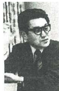
春風イチロー師匠

ですから、居候になったわけですよ。それがなんと、師匠の春風亭柳橋（注：6代目。日本芸術協会会長を44年間務めた）の所には、4家族もいて、とても内弟子にはなれないわけ。それで埼玉県の大宮の谷川真海先生の教会に居候になったんです。