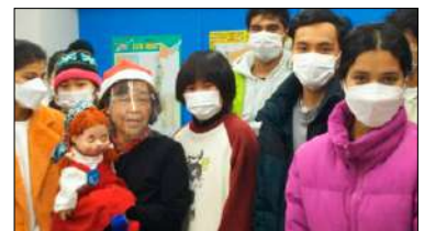
春風イチゴさんと日本語学校の学生たちのクリスマス（2022年12月名古屋）

※お願い：通信欄には、お手数ですが、振り込みの内訳（2022年度会費、寄付）をご記載ください。